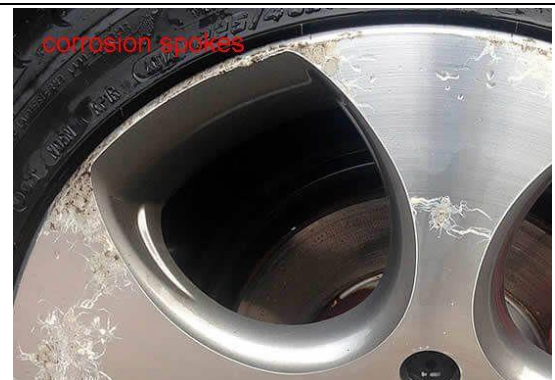
Beispiel Nr. 7

Check EUWA ES Standard on latest version prior to use