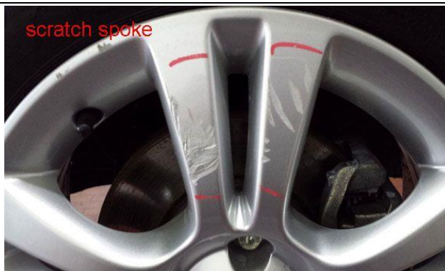
Beispiel Nr. 6-B