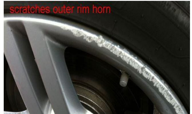
Beispiel Nr. 4