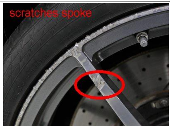
Beispiel Nr. 6-A