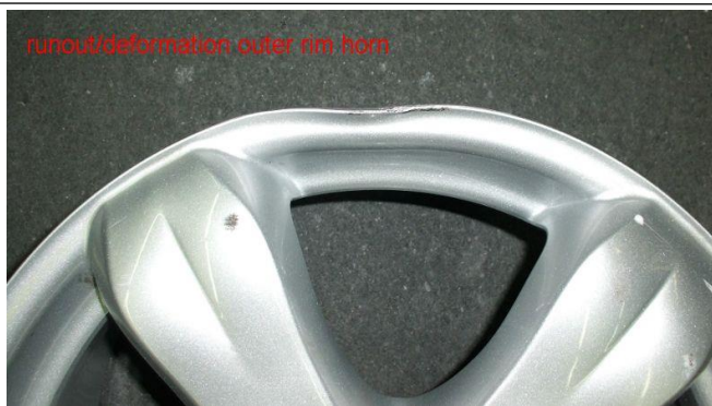
Beispiel Nr. 5