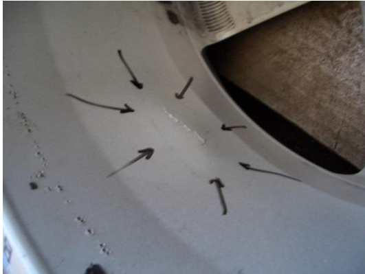
Beispiel Nr. 3